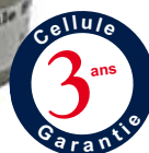
Cellule Infrarouge XP IR